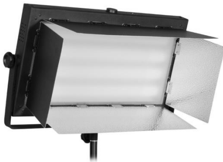
Beispiel für eine Flächenleuchte mit Streuscheibe

Bei einigen Flächenleuchten ist typischerweise ein Diffusor oder eine Streuscheibe im Lieferumfang. Durch den Einsatz dieser Vorsätze wird weiches, schattenreduzierendes Licht erzeugt. Der Stoff-Diffusor wird einfach über die etwas ausgeklappten Lichtklappen gezogen. Eine Streuscheibe aus Kunststoff wird direkt vor den Leuchtröhren angebracht und an den Seiten vorne an der Gehäuseinnenseite eingeklipst.