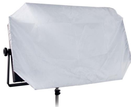
Beispiel für eine Flächenleuchte mit Stoffdiffusor