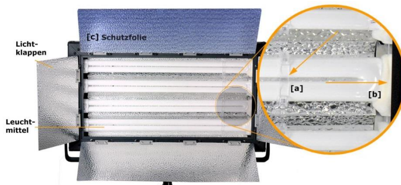
Abbildung oben zeigt beispielhaft eine Flächenleuchte vor dem ersten Gebrauch.

... müssen Sie ggfs. noch die vorhandenen Schutzfolien auf den Lichtklappen [c] entfernen. Ebenfalls sind die die kleinen Schaumstoffeinlagen [b] zu entfernen. Halteklammern aus Kunststoff [a] bitte so belassen.